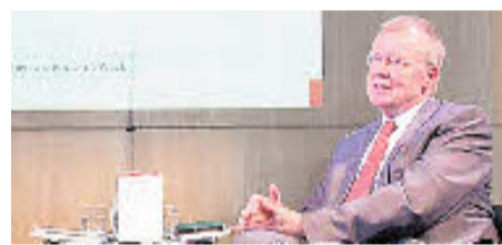
Ruprecht Polenz (CDU)

RUPRECHT POLENZ teilt seine Haltung zur Zugehörigkeit der Türkei zur EU keineswegs mit jedem Christdemokraten. „Ich muss meiner Partei ein bisschen dankbar sein – die hält das aus“, sagt der Bundestagsabgeordnete aus Münster. In der Edition „Standpunkte“ der Körber-Stiftung ist sein Buch „Besser für beide: Die Türkei gehört in die EU“ erschienen. Darin entschärft der Jurist die Bedenken der Beitrittsgegner Schritt für Schritt und resümiert: „Die EU-Mitgliedschaft der Türkei dokumentierte, dass die EU auch für die Konflikte des 21. Jahrhunderts das Modell einer Friedensordnung ist, so wie sie es in den vergangenen 60 Jahren für die Konflikte des 20. Jahrhunderts unter Beweis gestellt hat.“ wal